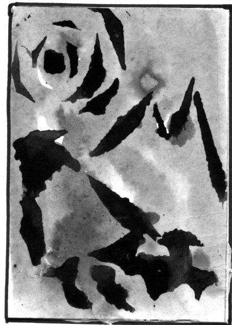
dessin de Patrick Serena, nos 2 bulletins p. 79

Les Nouvelles Littéraires, 8/09/55, la Gazette des Lettres , titré “quels traits caractéristiques de votre province reconnaissez-vous en vous-même ?” AD 04