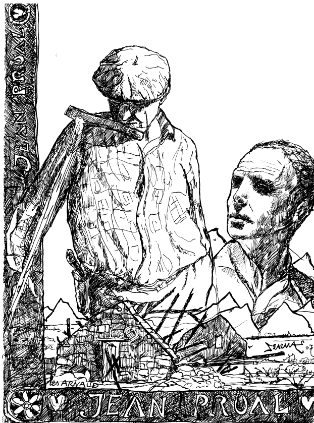
dessin de Patrick Serena